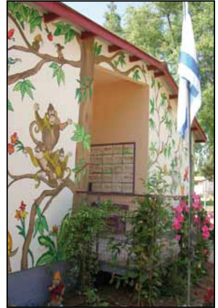
בצילום: חזית גן 'ורה' המחודשת

מטבע הדברים מתווספים מדורים ופינות חדשות. איש לא פנה והציע נושאים למאמר דעה ולפיכך המדור לא יופיע בשלב זה. בהמשך לרוח ההתחדשות המנסבת בברור-חיל, בחרנו לשים דגש בגיליון על נושא החינוך. הכתבה המרכזית בעיתון היא ריאיון עם רכזת החינוך החדשה, הדס פלג. כמו כן מוגשים דברי מינהלת החינוך החדשה, ששופכים אור על כוונותיה ועל פעילותה הרבה והמבורכת.