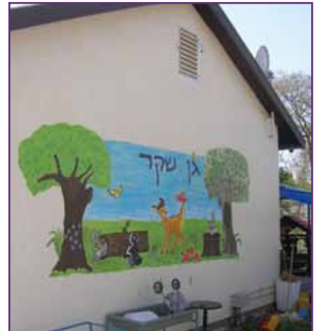
בשער: תמונות מחגיגות פורים בקיבוץ