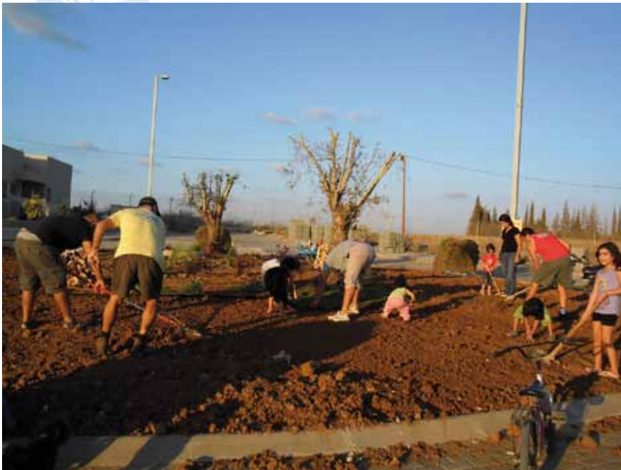
מלאכת העידור והשתילה בכיכר ההרחבה בעיצומה...