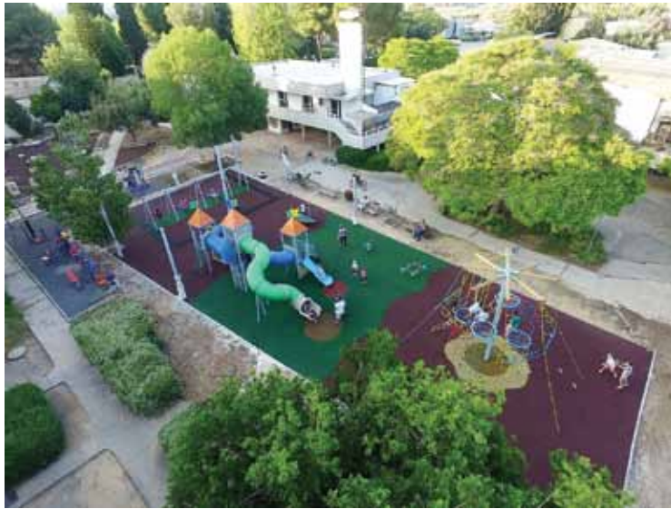
גן השעשועים החדש במרכז הקיבוץ.